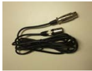
Cable 3m DMX